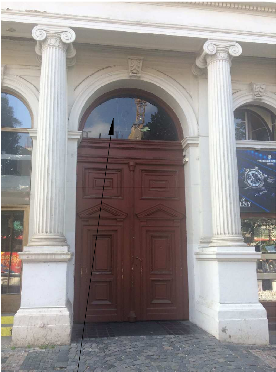
PROSKLENÝ NADSVĚTLÍK - ČIRÉ SKLO - bude ponecháno a vyčištěno